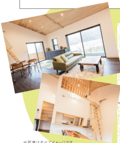
※写真はすべてイメージです。 実際のものとは異なります。